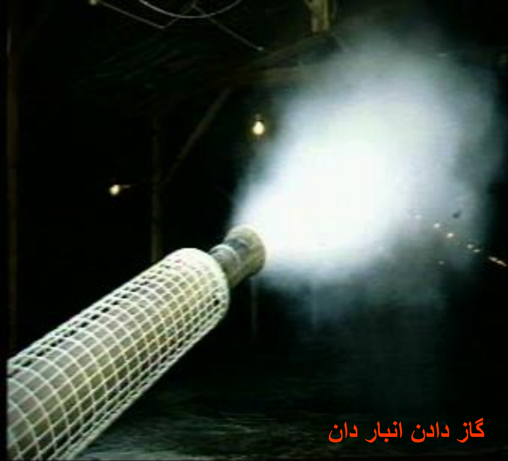
گاز دادن انبار دان

اقلام دان که از دوره قبل باقی مانده را باید دریک نقطه سر بسته جمع آوری کرد و با گاز فرمالین آن را ضد عفونی نمود. دربها و پنجره های انبار دان را باید کاملا بست و محوطه داخلی آن را باید با گاز فرمالین ضد عفونی کرد.