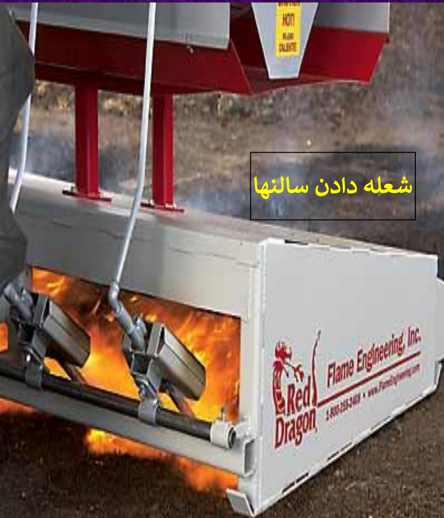
شعله دادن سالنها

سالنهای پرورش را باید پس از خروج کود دوره قبل کاملاً شستشوداده و سپس با محلول ضد عفونی مناسب ضد عفونی کرد و پس از آن با شعله افکن شعله داد و سپس اقدام به جوجه ریزی کرد.