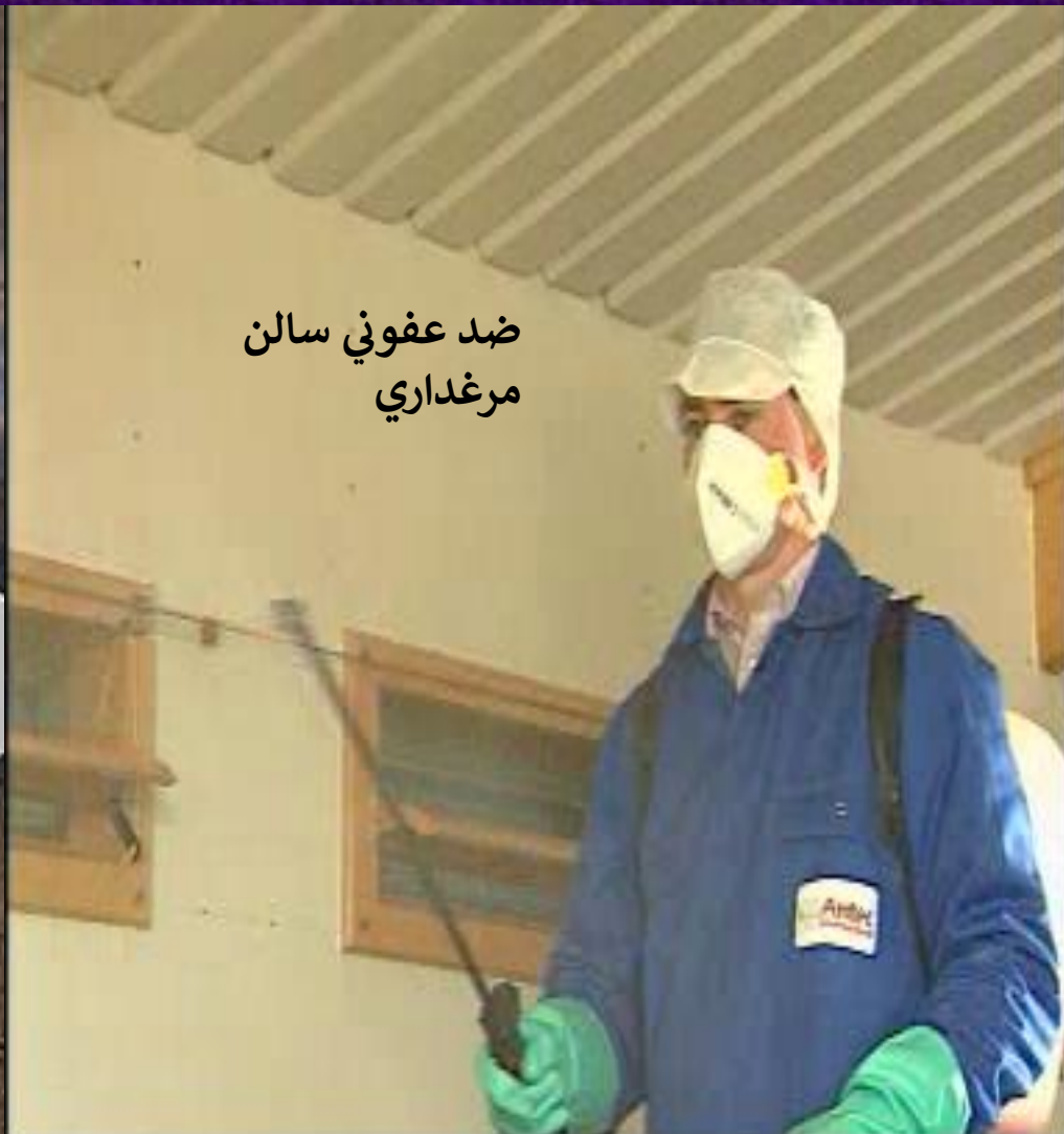
ضد عفونی سالن مرغداری